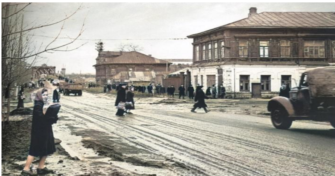
Фото 5. Дом по Ул. Урицкого