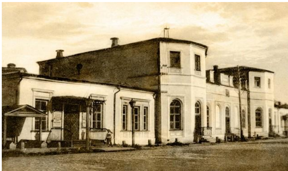
Фото 1. Зимний театр на Театральной улице