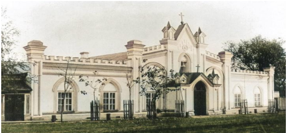
Фото 3. Евангелическо-лютеранская кирха