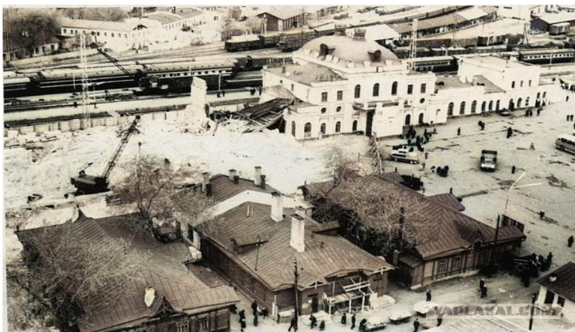
Фото 6. Железнодорожный вокзал Пенза -1