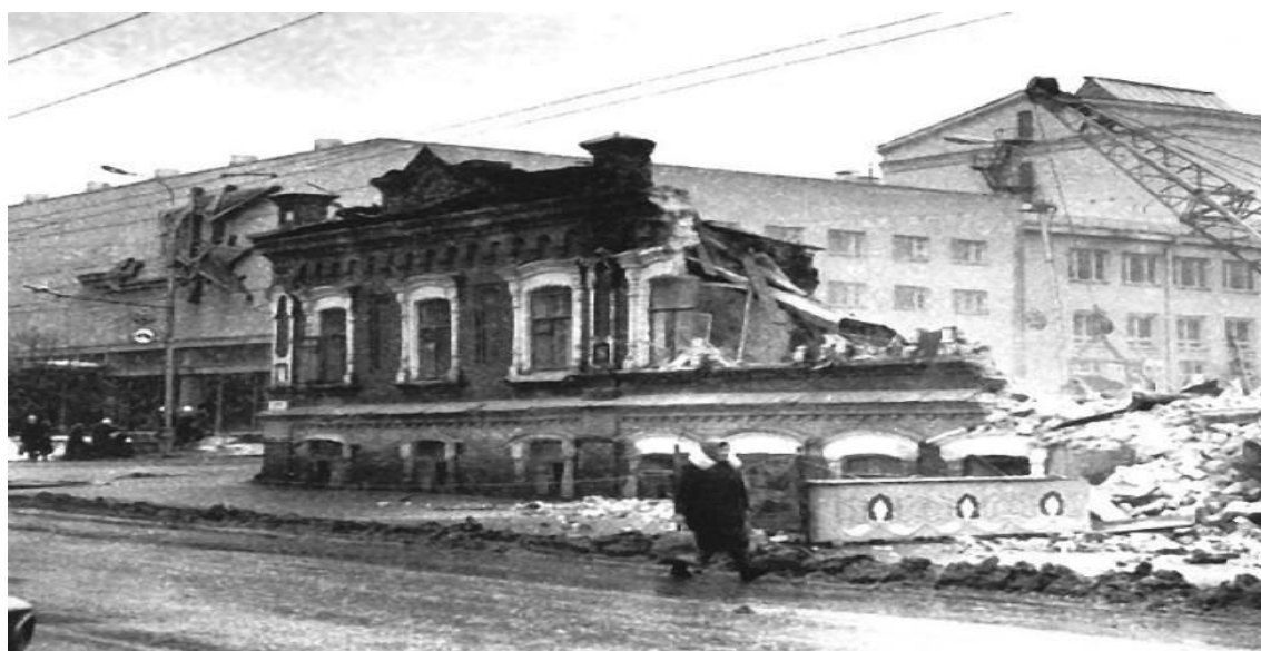
Фото 2. Здание на ул. Кирова (напротив ЦУМа).